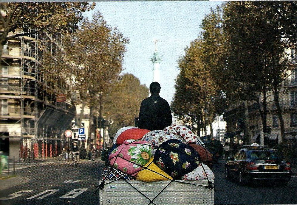
Kimsooja, Beitar truck - Migrants , 2007. Collection du MAC VAL / Photo Jacques Fajjir.

exposition jusqu'au 20 mai, Galerie Joseph Tang, Paris III e