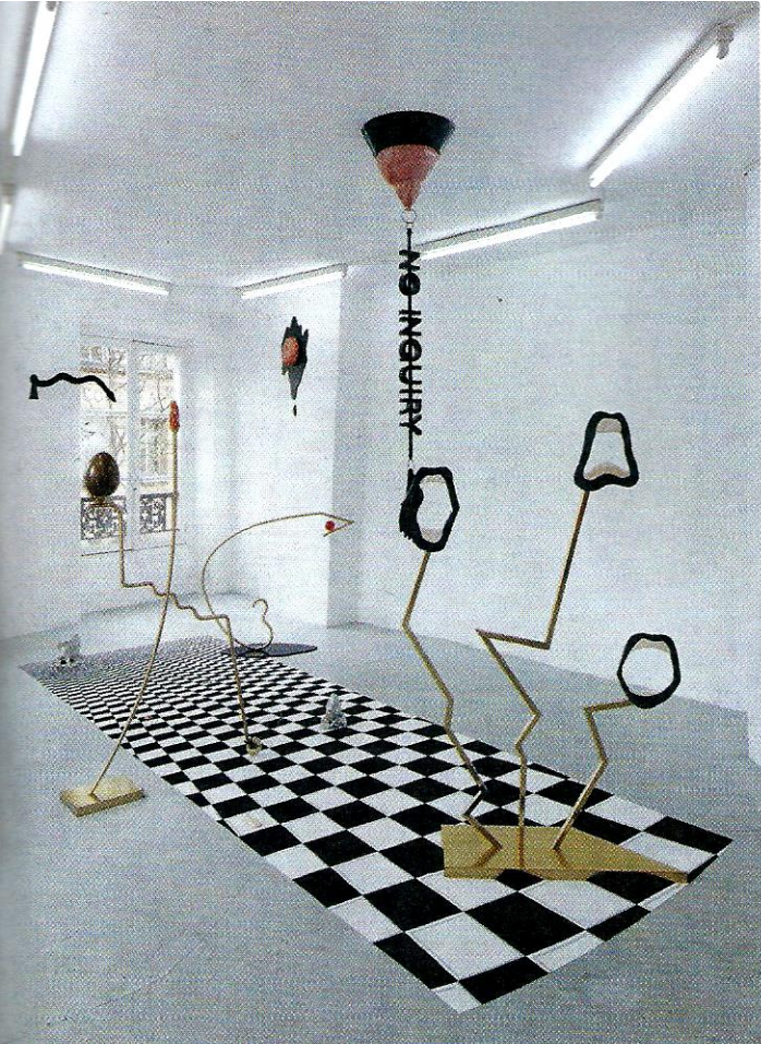
Julie Bena was a cold place... She explained as we chatted in the market, before Bena was a cold place... 2017